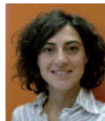
DIRETTRICE RESPONSABILE ROSSANA SPARACINO

TESTATA IN COMODATO ALL'EDITRICE CE.S.A. CENTRO SERVIZI PER L'AGRICOLTURA SRL