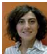
DIRETTRICE RESPONSABILE ROSSANA SPARACINO

TESTATA IN COMODATO ALL'EDITRICE CE.S.A. CENTRO SERVIZI PER L'AGRICOLTURA - SRL