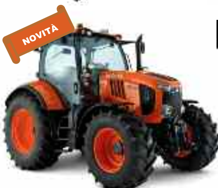
M7132 – M7152 – M7172 da 130 a 200 CV

Kubota. I NOSTRI CAVALLI SONO SOTTO AL COFANO... LO SAPEVI?