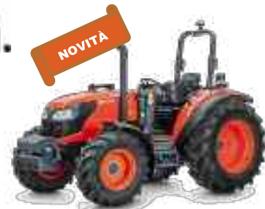
NOCCIOLETO - VIGNETO da 50 a 130 CV

Kubota. I NOSTRI CAVALLI SONO SOTTO AL COFANO... LO SAPEVI?