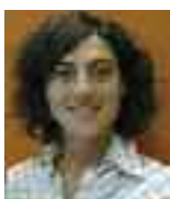
DIRETTRICE RESPONSABILE ROSSANA SPARACINO

TESTATA IN COMODATO ALL'EDITRICE CE.S.A. CENTRO SERVIZI PER L'AGRICOLTURA SRL