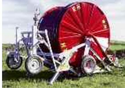
IRRIGATORI SEMOVENTI RM