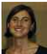
DIRETTRICE RESPONSABILE ROSSANA SPARACINO

TESTATA IN COMODATO ALL'EDITRICE CE.S.A. CENTRO SERVIZI PER L'AGRICOLTURA - SRL DIREZIONE E AMMINISTRAZIONE: VIA TROTTI, 122 - AL - TEL. 0131 43151/2 VIDEOIMPAGINAZIONE E STAMPA: LITOGRAFIA VISCARDI SNC VIA SANTI, 5 - ZONA IND. D4 - AL AUTORIZZAZIONE TRIBUNALE DI ALESSANDRIA N. 59 DEL 15.11.1965 AUT. DIR. PROV. PT AL N. 75 HANNO COLLABORATO: PAOLO CASTELLANO, MARCO OTTONE, MARIO RENDINA, PAOLA ROSSI, MARCO VISCA FINITO DI IMPAGINARE IL 28/07/2010