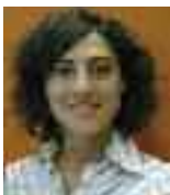
DIRETTRICE RESPONSABILE ROSSANA SPARACINO

TESTATA IN COMODATO ALL'EDITRICE CE.S.A. CENTRO SERVIZI PER L'AGRICOLTURA SRL