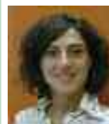
DIRETTRICE RESPONSABILE ROSSANA SPARACINO

TESTATA IN COMODATO ALL'EDITRICE CE.S.A. CENTRO SERVIZI PER L'AGRICOLTURA - SRL