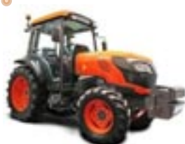
Serie M4002 – da 66 a 74 CV