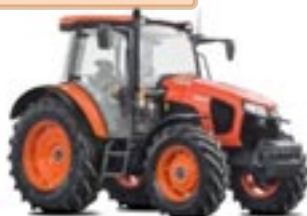
Serie M5001 – da 95 a 113 CV