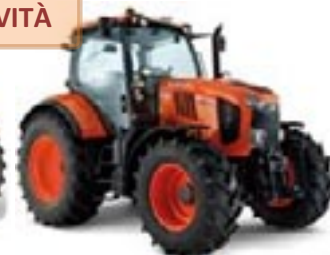
Serie M7003 – da 130 a 170 CV