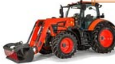
Serie M6001 – 135 CV (150 CV)