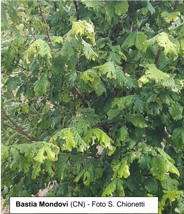
Bastia Mondovi (CN)