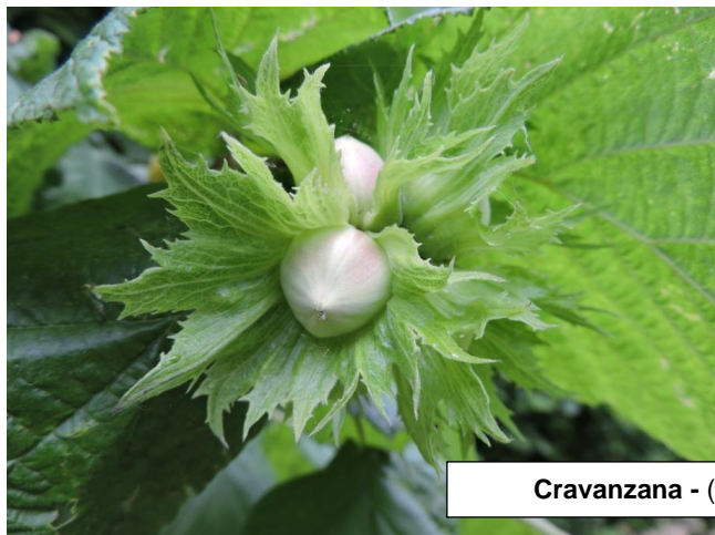
Cravanzana - (09/06/2020)