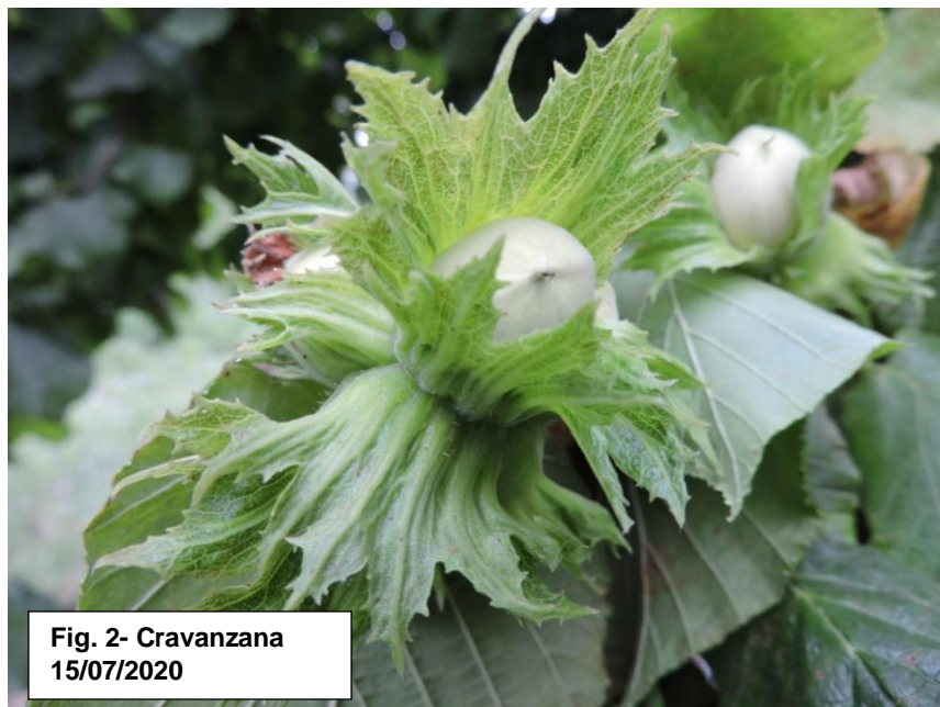
Fig. 2- Cravanzana 15/07/2020