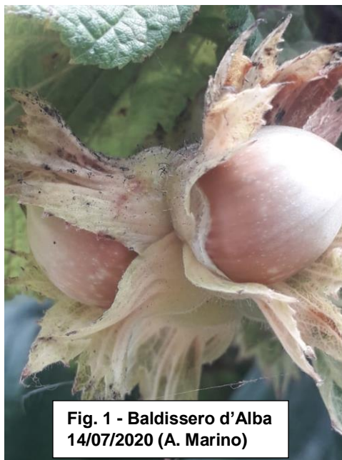
Fig. 1 - Baldissero d'Alba 14/07/2020 (A. Marino)