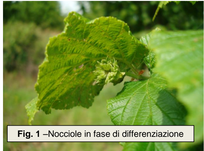
Fig. 1 –Nocciole in fase di differenziazione

Fenologicamente ci troviamo in fase di differenziazione del frutto (fig. 1) con presenza all'interno del guscio di solo tessuto spugnoso.