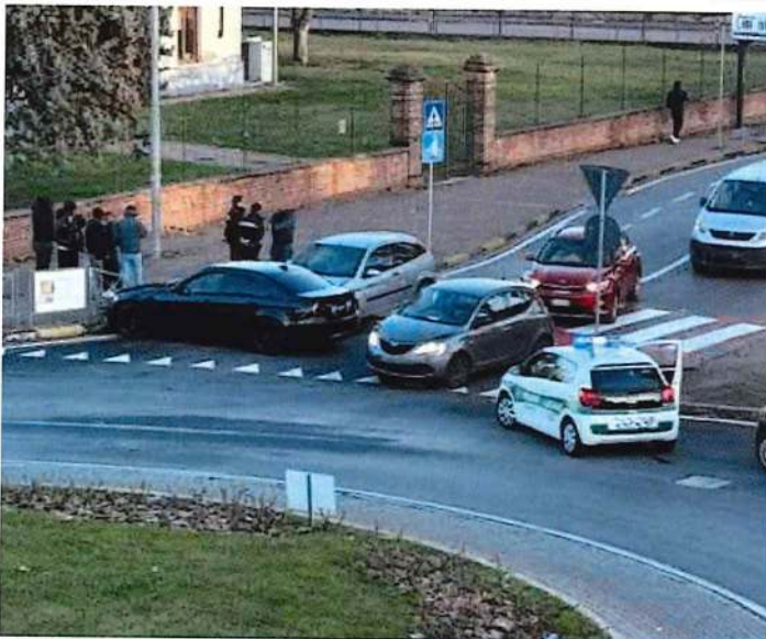
Martedì, 6 Gennaio 2026 - 16:31 Cronaca - Alessandria