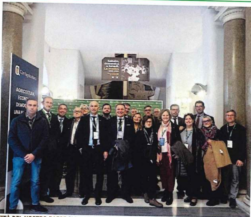
PROTEGGERE L'AGRICOLTURA SIGNIFICA PROTEGGERE L'IDENTITÀ DEL NOSTRO PAESE Si è svolta a Roma l'assemblea nazionale di Confagricoltura