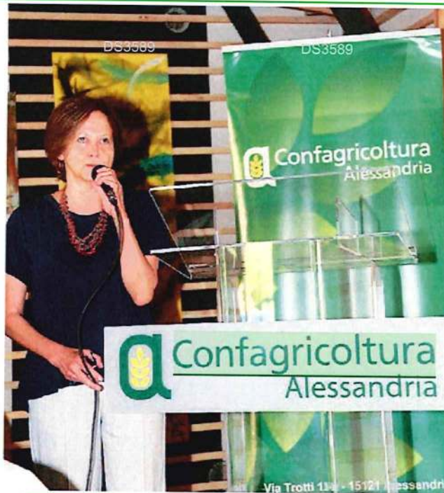
Da Confagricoltura . Una lettera alla Regione con diversi problemi da affrontare