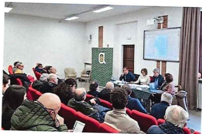
Un momento dell'assemblea di zona ad Alessandria