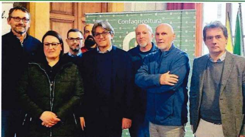
Assemblea di Zona di Casale - 1. Il nuovo Consiglio eletto nella giornata di venerdì 23 gennaio ai Leardi