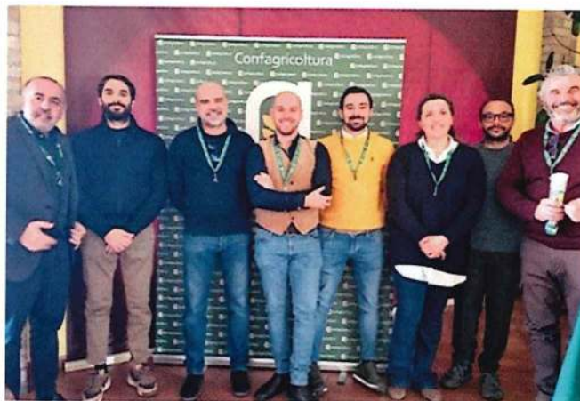
Il Consiglio direttivo di Confagricoltura per la zona di Tortona