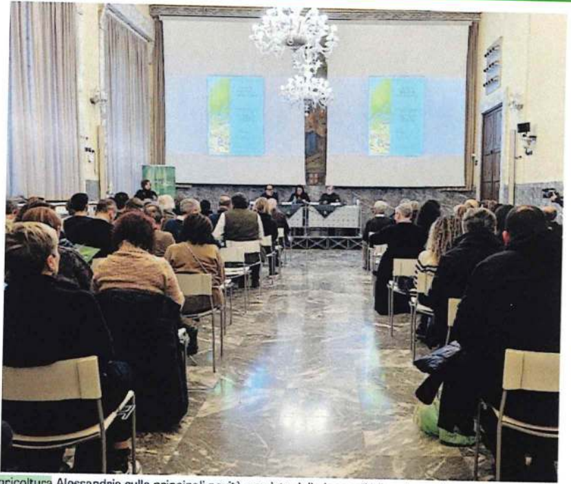
4 FEBBRAIO Grande partecipazione all'incontro promosso da Confagricoltura Alessandria sulle principali novità previste dalla legge di bilancio per il comparto agricolo