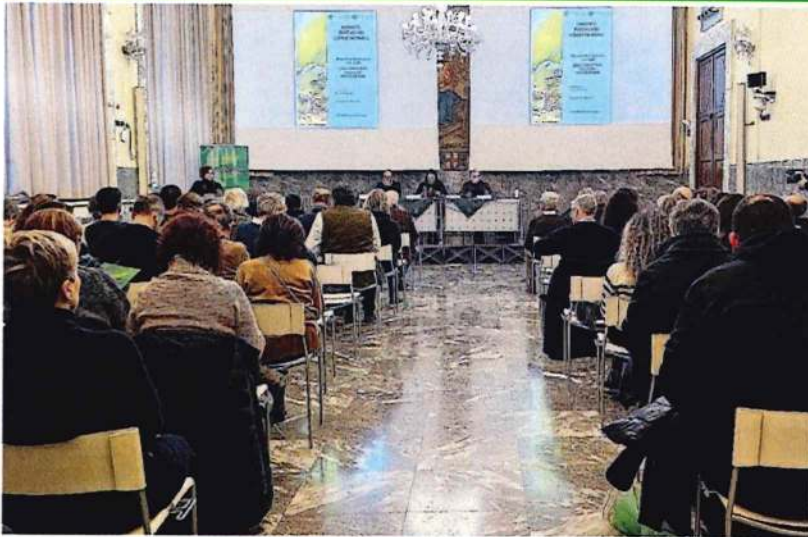
Il convegno. Promosso da Confagricoltura Alessandria ad inizio mese a Palazzo Monferrato